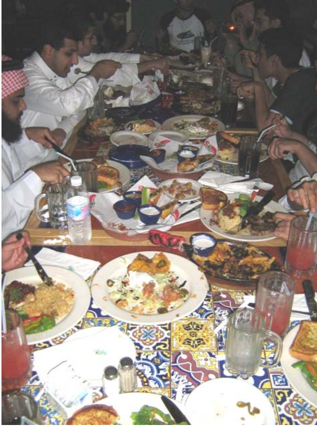
(الصورة في مطعم "تشيليز" !!)

قامت لجان الأنشطة الطلابية بكلية الطب برحلة ترفيهية إلى المنطقة الشرقية خلال الفترة من الأربعاء 1429/4/3 هـ إلى الجمعة 1429/4/5 هـ، وقد شارك في هذه الرحلة 14 طالبا من طلاب الكلية، وكان الانطلاق عند الساعة الخامسة من عصر يوم الأربعاء، والعودة يوم الجمعة مساء، وقد تخلل الرحلة العديد من