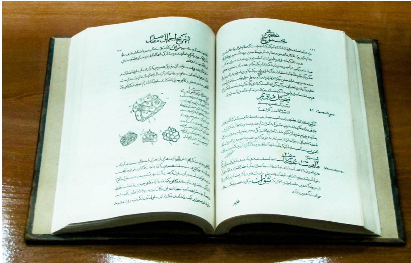
ترجمة فارسية لكتاب القانون في الطب