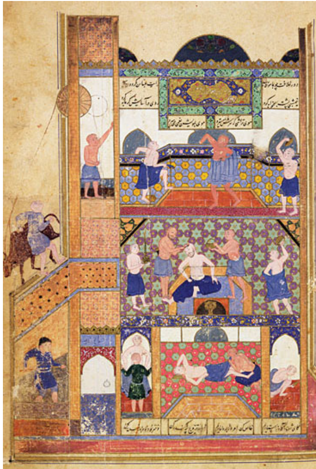
Bimaristan del Califa al-Mamun. (s. IX)

المسلمون هم أول من أسس المستشفيات في العالم فأول مستشفى إسلامي أسس في عهد الخليفة الأموي الوليد بن عبد الملك ، والذي حكم من سنة 86 هـ - إلى سنة 96 هـ ( ، وكان هذا المستشفى متخصصاً في الجذام ، وأنشئت بعد ذلك المستشفيات العديدة في العالم الإسلامي ، وبلغ بعضها شأواً عظيمًا ؛ ، وتُعتبر من أوائل الكلبيات والجامعات في العالم . بينما أنشئ أول مستشفى أوروبي في باريس بعد ذلك بأكثر من تسعة قرون .