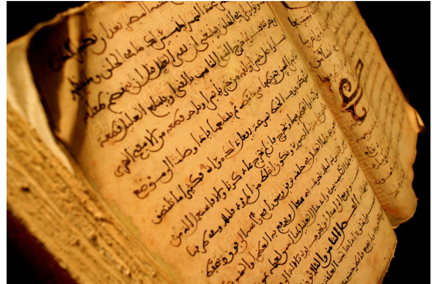
Vol. 30 of Surgery book d'Abu-l-Qasim al-Zahrawi (Abulcasis). Century X a.C

ولد في عام 936 ميلادية، وازدهرت شخصيته في عهد الخليفة الأموي الثامن عبد الرحمن الثالث، كطبيب خاص له، وذلك في القرن العاشر في مدينة قرطبة. فحالم استكمل دراسته التحق بعمل في المستشفى الذي أنشأه الخليفة خصيصاً في قرطبة وراح يمعن النظر في الطرق والأوسائل المستخدمة في علاج مختلف الأمراض وبعد سنوات من العمل في المستشفى، لكون معتقداته الخاصة وألف ثلاثة كتب. وكذلك وضع عدداً من الكتب عن العمليات الجراحية التي قام بها. وقد ظلت هذه الكتب نصوصاً يعتد بها لحوالي ألف عام. وما زال أحد هذه الكتب موجوداً في باكستان كأحد المراجع النادرة، وذلك في مكتبة "م عهد الأبحاث الإسلامية" في إسلم آباد، واسم هذا المؤلف هو: «التصريف لمن عجز عن التأليف»